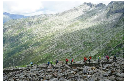
○モンテモロ峠を越えサース・フェーへ