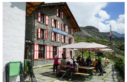
○ガビット小屋から屋根の形状が面白いアラニーヤを通りパストレー小屋へ