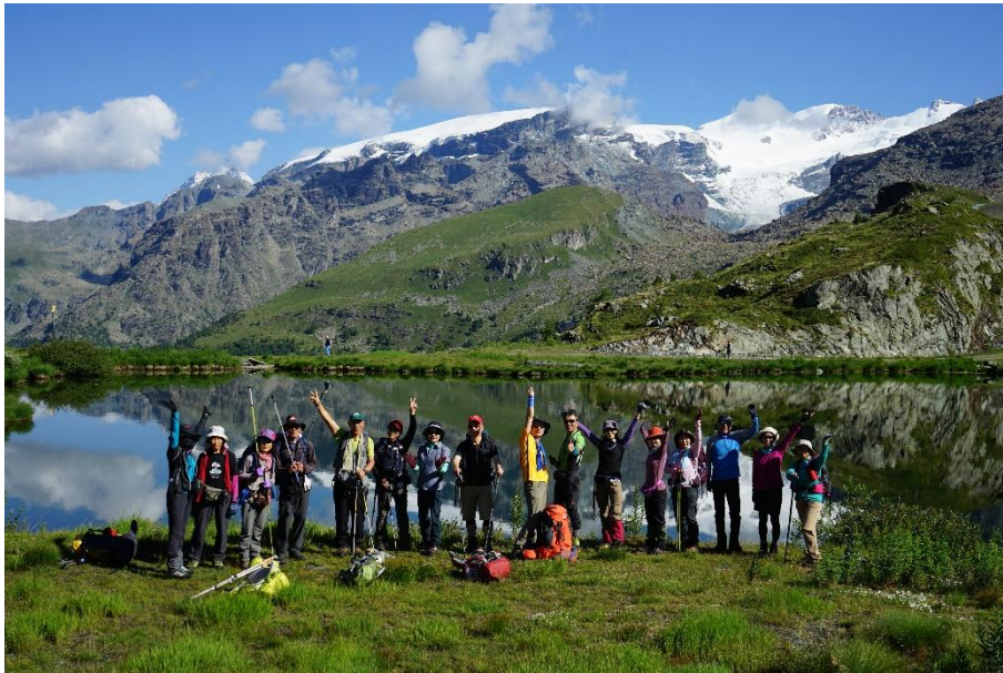
(左奥・マッターホルン見納7月22日)