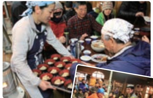
お正月はおせちとお雑煮！