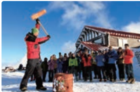
毎年恒例！新年餅つき大会！