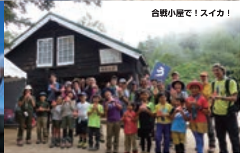
合戦小屋で！スイカ！