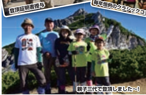
親子三代で登頂しました~!