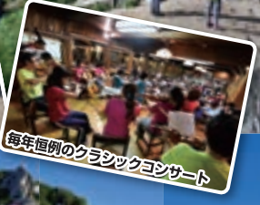
毎年恒例のクラシックコンサート