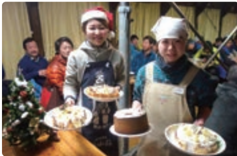
燕山荘のサンタクロースからの美味しいプレゼント！

雪化粧の燕岳、足下まで真っ赤に染まる絶景の御来光など燕岳が一番キレイなシーズンとなります。スタッフ一同、楽しいイベントを多数ご用意してお待ちしています。 ※厳冬期の燕岳は体力、装備、天候による判断など自己責任の世界となります。