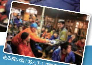
振る舞い酒(おとそ)で乾杯！