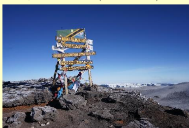
キリマンジャロ5895m頂上 (2492)