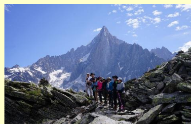
モンタンベール・ドリユー (2471)