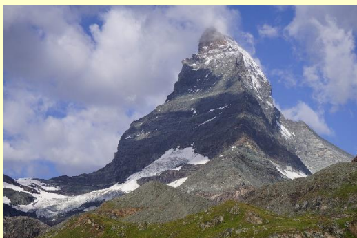
マッターホルン (2461・2471)