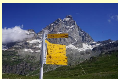
モンテ・チェルビーノ (2471)