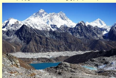
レンジョパス下 5250m (24B1)

※上記価格の他に 燃油サーチャージ(4月現在 欧州・北米 約¥70,000)及び各地空港税等が必要です。なお、カタール航空やカンタス航空など燃油サーチャージを運賃に含め明示していない航空会社は、同地域を結ぶ他社便と同等額をお願いしております。