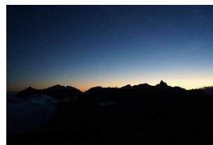
(7月初旬の表銀座コース)

コロナが終息した暁には世界の雄大な山々に感動、感激していただき、そして十分満足いただける旅を目指して参ります。2022年も引き続き、何卒 宜しく願い申し上げます。