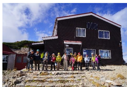
(10月初旬の表銀座コース)

海外で活動する天溪ですが、一部の皆様より国内ハイキングのご依頼をいただき、幾つかの主要都市が緊急事態宣言を発する中、7月初旬及び10月初旬に燕岳・大天井岳の山行を行いました。