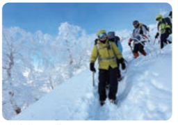
燕山荘を目指して