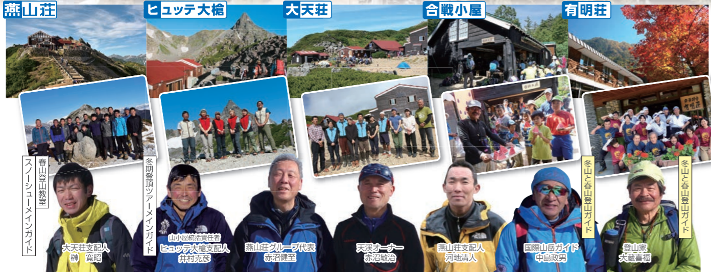
燕山荘 ヒュッテ大槍 大天荘 合戦小屋 有明荘