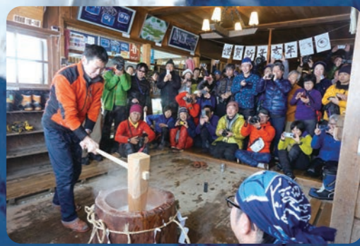
新年恒例のお餅つき つぎたてのお餅を振舞います