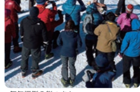
毎年恒例の餅つき！