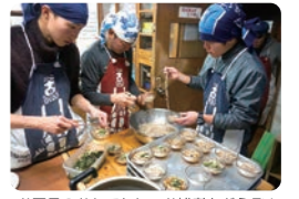
お正月のおもてなし、お雑煮をどうぞ！