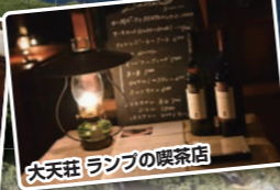
大天荘 ランプの喫茶店