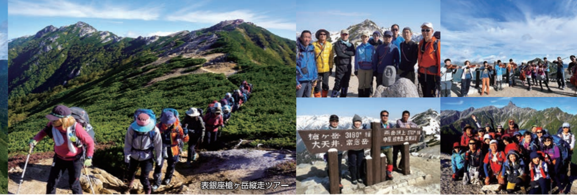
表銀座槍ヶ岳縦走ツアー