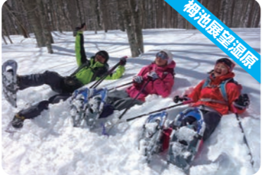
キラキラ輝く樹氷が神秘的～！