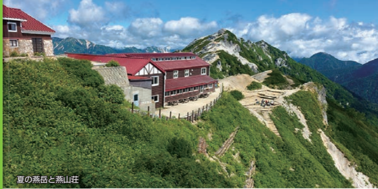
夏の燕岳と燕山荘