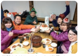
特製のクリスマスケーキで乾杯～！