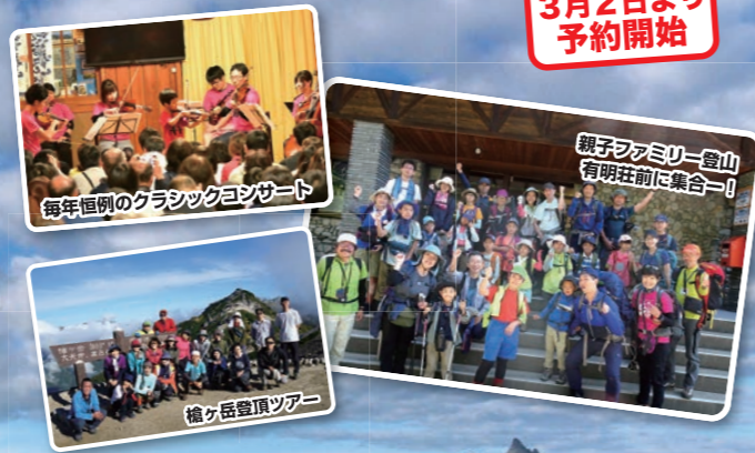
親子ファミリー登山 有明荘前に集合ー！ 毎年恒例のクラシックコンサート 槍ヶ岳登頂ツアー