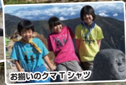
お揃いのクマTシャツ