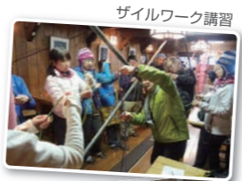
ザイルワーク講習