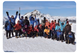
一年のスタートを燕岳山頂から