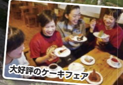
大好評のケーキフェア