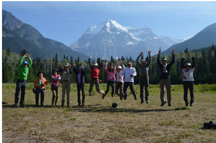
(ロブソンランチ 7/12 日)

好天は良い事ばかりとは限りません。ジャスパーへ向かう朝、山火事による視界不良で氷河ハイウエーが通行止との知らせ。この道通らなければエドモントン経由で 400Km以上迂回するはめに。ジャスパーを諦めレイクルイーズ周辺ハイキングに出かけた所、午前 10 時過ぎ開通の知らせ。急遽計画を再変更しジャスパーへ。時間の都合でパーカーリッジのハイキングは中止。余談ですが、この日のジャスパーは 32 度、この地としては異常高温でした。