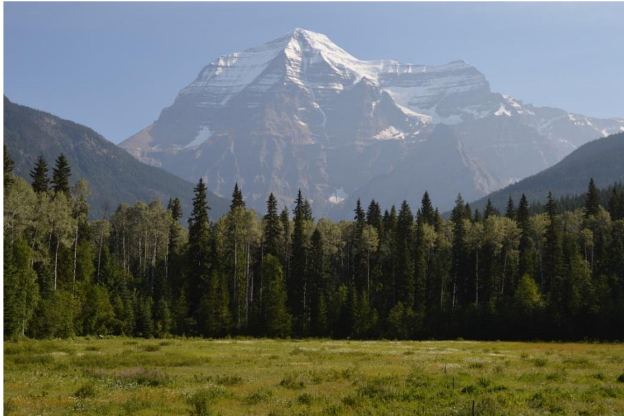
(ロブソンランチ 7/12日)

昨年は豪雨によりボウ川の大氾濫があったこの地、今年も6月は天候が不順だったとか。日本はと言えば我々の出発直前にスーパー台風8号が沖縄近海を北上し、九州西域から本土を伺う勢い。台風の渦巻は遥か400km彼方の宇宙ステーションからも確認され、クルーから「台風近くの皆様どうかご無事で」とメッセージがよせられた超大物。まだ7月が始まったばかりなのに!! 所でロッキーはラッキーにも私たちが到着したころは気温も上がり、毎日快晴の連続でした。