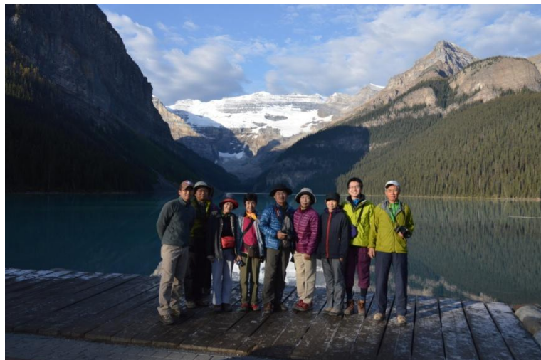
(レイクルイーズ 9/21日)

翌日はマリーン・レイクの上部、オパールヒルへ登りました。天候は不安定でしたがそんな時は動物達が現れるものです。下の写真はビッグホーンシープのメス、車道に出てきてコンニチハ。