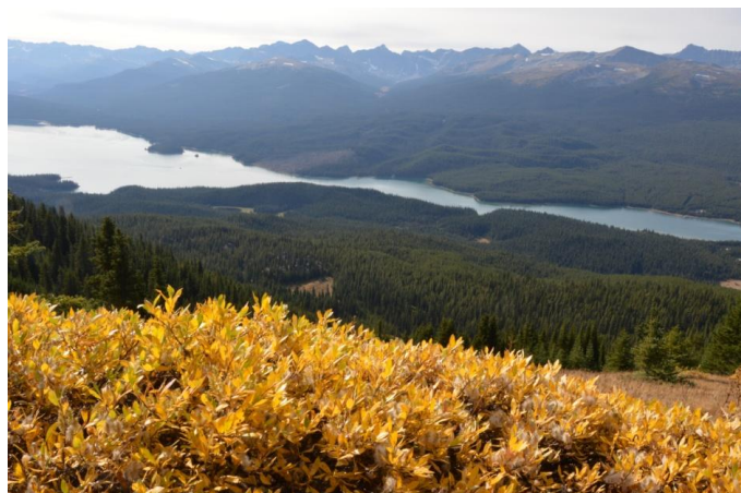
(オパールヒル 9/22 日)

夏のオパールヒルに出ていた‘違反者は$ 25,000 以下の罰金に処す’ のとんでもない侵入禁止の御触れは解除されていましたが、やはりここはクリズリーの生息地。ド近眼の熊たちから身を守るために一団になり、果てし無く広がるオパールヒルからの黄葉を堪能しました。右下の写真は熊の大好物バッファローベリーで一日中食べているとか。人が食べても害は無い様ですが渋くて不味く吐き出してしまいます。お勧めできません！