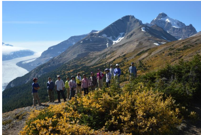
(パークアリッジ 9/21 日)

アイスフィールド・パークウェイを北上し、コロンビア大氷原の雪上車観光やパークアリッジハイキングを行い、ジャスパーへ縦断しました。所でパークアリッジは大氷原の脇にあり夏でも寒い所。しかし、今年は何故か風も無く半袖姿で行動出来るポカポカ陽気にビックリでした。