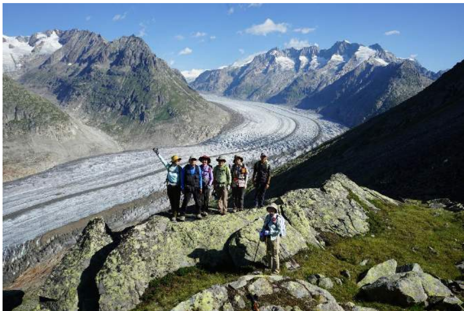
(世界遺産アレッチ氷河 7 月 30 日)

ブリーグからシンプロントンネルをイタリア側に抜け、路線バスに乗り先のツールドモンテローザでも泊まったマクナチャーガへ。閑静なこの村で一時を過ごし、翌日モンテモロ峠を越え再びスイスのサースフェー入り。この日 8 月 1 日はスイスの建国記念日で村中がお祭り騒ぎでした。旅の最後はシンプロン峠を今度は車で越えてミラノに至り、帰国の途に就きました。