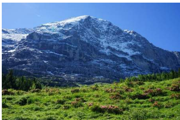
(アルペンローゼとアイガー北壁 6月30日)