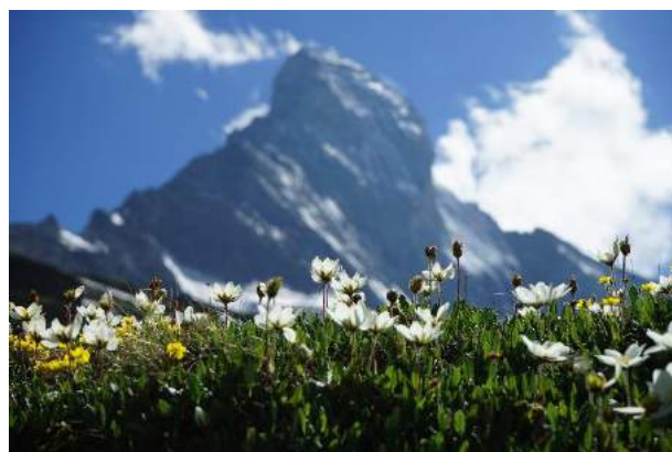
(マッターホルン北壁 6月25日)

今夏の天溪ツアーはこのツアーでスタートし、「花のカナディアンロッキー9日間」、「ツールドモンブラン 10日間」、「ツールドモンテローザ 10日間」、「スイス楽園ハイキング 10日間」と続きます。