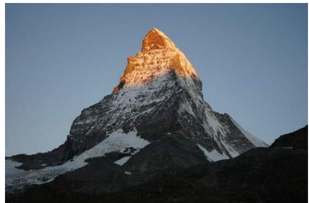
(朝焼けのmatterホルン 7月4日)