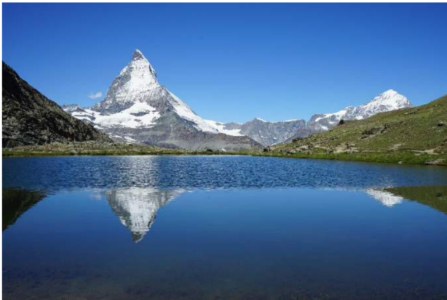
(逆さまッターホルン&ダンブランシュ 7月3日)

アルプスの観光客の中に今年は多くの日本人ツアーが散見されました。パリ、ロンドンのテロの影響でこちらへ回ったのでしょうか。ホテルとの雑談中にテロでお客様が減っていると話したら、お前の国の方が隣国のミサイルで数段危ない。テロで危ないと海外旅行を敬遠しても、ミサイルが飛んできそうな日本にいても、危なさは大して変わらない様な。まあ、イメージの問題でしょうか。世の中のことはさておき、自然は洋の東西を問わずどこに行っても良いですね！