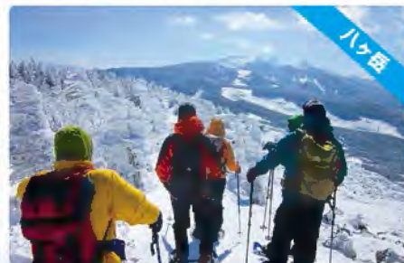
樹氷に囲まれてとっても神秘的!