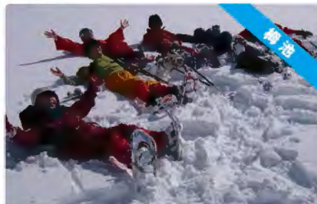
雪のベッドで一休み...