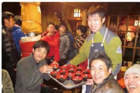
2014.12/31 年越しパーティー 年越しそば・振る舞い酒