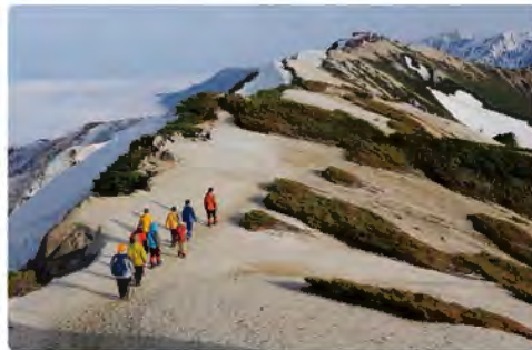
残雪の燕山荘とってもキレイ!