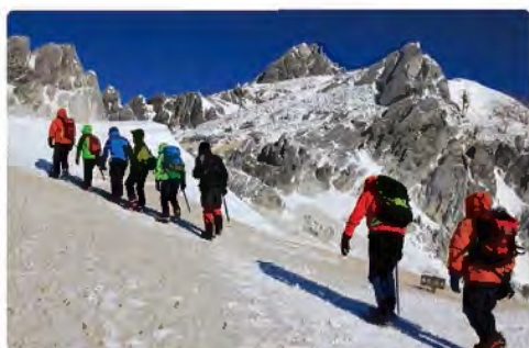
ガイドスタッフのおかげで安心して登頂できました！