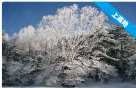
白樺の樹氷がキラキラ輝いて神秘的~!