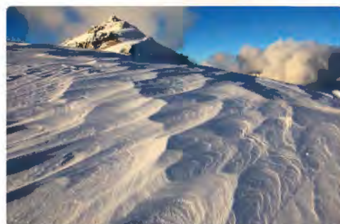
雪庇にできたシュカブラと燕岳