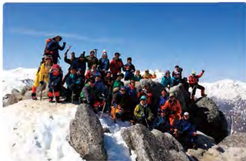
登山———!! 雪山が楽しくなりました!