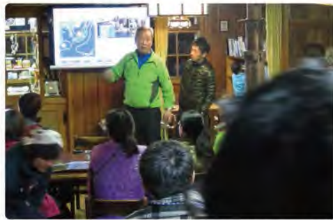
山の天気はあなどれない。天気予報の見方をしっかり学ぼう!