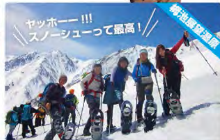
山ガールは冬でも元気いっぱい! ハイ!チーズ