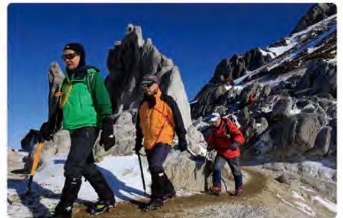
雲ひとつない澄んだ青空に大感動~!