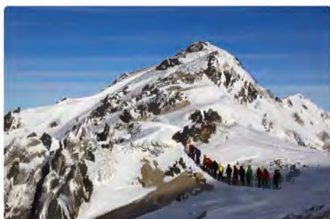
雪化粧の燕岳は一年で一番きれい～