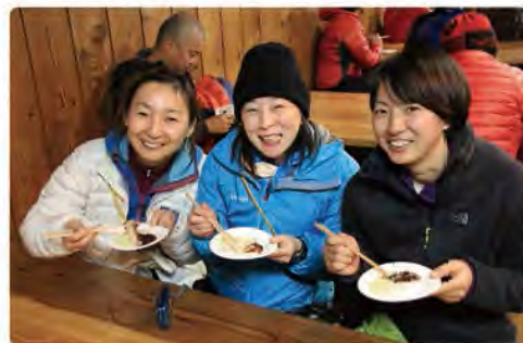
つきたてのお餅で新年を祝えるなんて、最高～！

環境の厳しい 年末年始の登山は、 適切な装備と知識、 万全の体調管理で登りましょう。