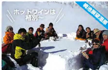
雪のテーブルを囲んで、ホットワインを乾杯~!