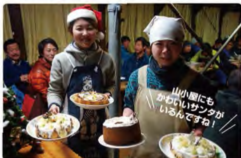
2014.12/21～23 クリスマスパーティー