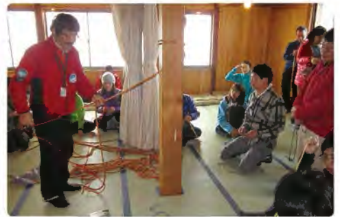
ザイルワーク講習会