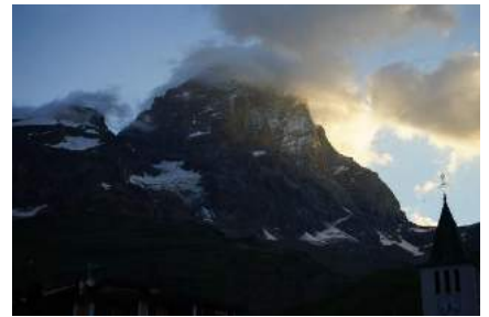
○チェルイビアからフェラーロ小屋、そしてガビット小屋