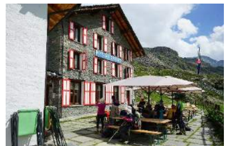
○ガビット小屋から屋根の形状が面白いアラニーヤを通りパストレー小屋へ