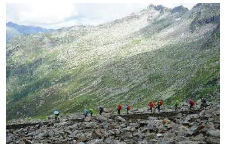
○モンテモロ峠を越えサース・フェーへ