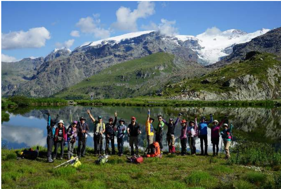
(左奥・マッターホルン見納7月22日)